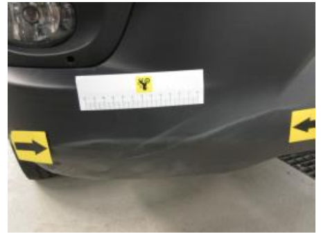
27. Støtfanger foran