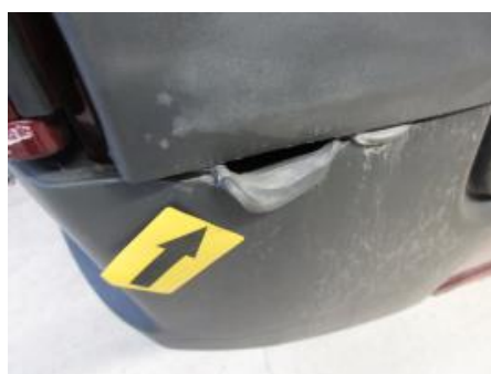
23. Støtfanger bak