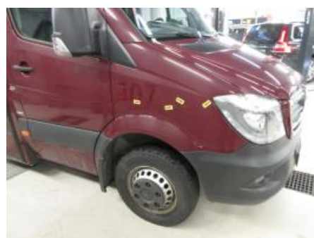
24. Karosseri generelt