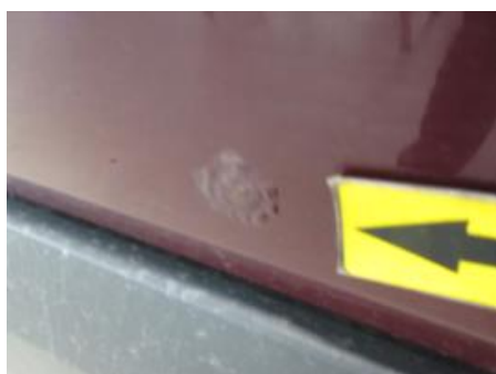
16. Venstre bakskjerm