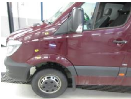
11. Karosseri generelt