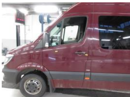
13. Karosseri generelt