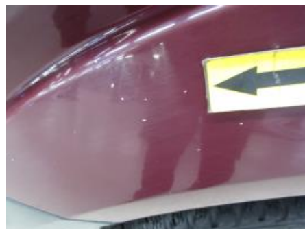
12. Karosseri generelt