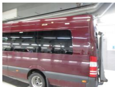
18. Venstre bakskjerm