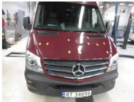
29. Karosseri generelt