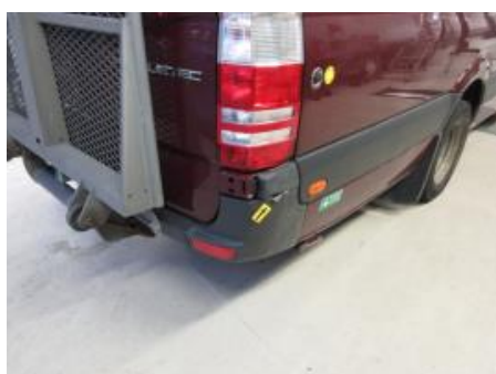
22. Støtfanger bak