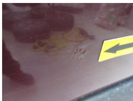
17. Venstre bakskjerm