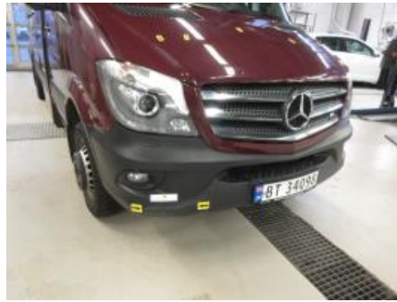
26. Støtfanger foran