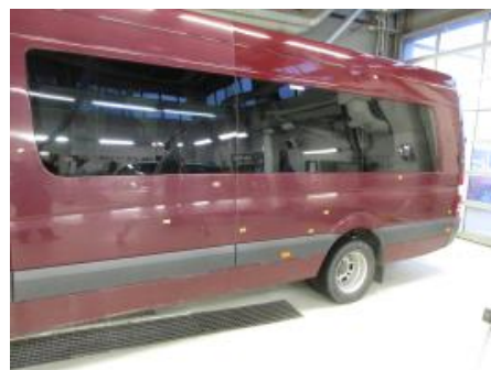
15. Venstre bakskjerm