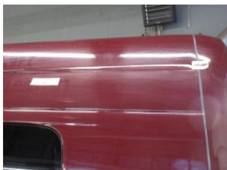
19. Venstre bakskjerm