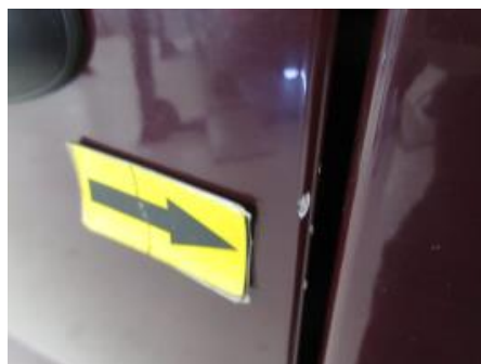
14. Karosseri generelt