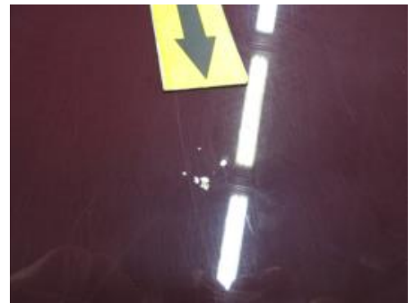
30. Karosseri generelt